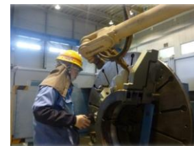
入社2年目 部品製造課 (兵庫工業高校卒)

“仕事を覚えること”にとても苦労しています。現時点では満足がいくほどの技能は習得できていませんが、焦らず目の前のことに集中しています。今後も、覚えることが多く苦労すると思いますが、大変な分だけ、やりがいも感じています。