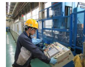
入社2年目 コイル製造課 (兵庫工業高校卒)

趣味のランニングをしたり、友人とゲームをして遊んだり、休日は仕事を忘れてリフレッシュしています。また、年4回ある長期休暇では、家族や友人と旅行に行くなどしています。