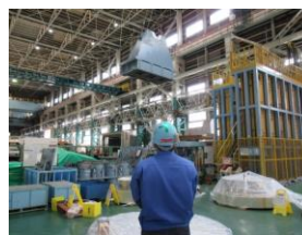
入社4年目 物流課 (彩星工科高校卒)

自分のしたい作業や、これなら長く続けられそう、と思う職場を探して、できる限り見学に行ったほうがいいです。入社しないとわからないことも多いですが、入社してすぐに辞めたいくなるような会社を選ばないように、しっかり情報収集をしてください。