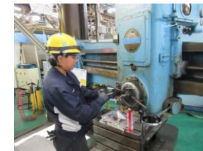
入社4年目 設備課 (神戸市立科学技術高校卒)

就職活動では、自分に合いそうな企業や求人を探して、悔いのない学生生活を過ごしてほしいと思います。インターンシップは、実際の会社の雰囲気を知ることができ、絶好の機会なので、積極的に活用してください。菱神テクニカでもインターンシップを行っていますので、是非一度足を運んでほしいです。